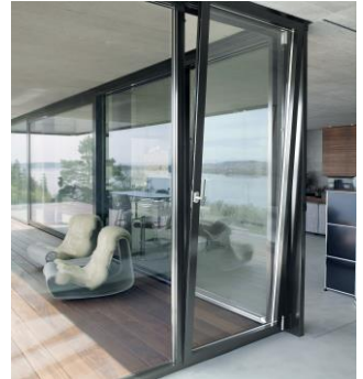
Porte fenêtre et fenêtre haute isolation

Nous vous proposons des solutions complètes sur mesure associant les qualités du vitrage isolant et de l'aluminium qui vous assurent sécurité, isolation thermique et acoustique.