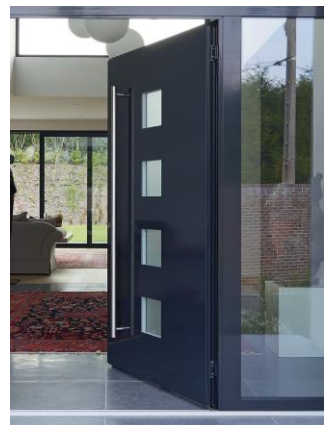
Porte haute sécurité

Notre gamme aluminium fait appel aux technologies les plus récentes afin d'atteindre les performances les plus élevées en matière d'isolation thermique et ainsi réduire votre facteur d'énergie. Nos profils aluminium répondent aux conditions imposées par les directives européennes ainsi qu'aux différentes normes relatives à la performance énergétique.