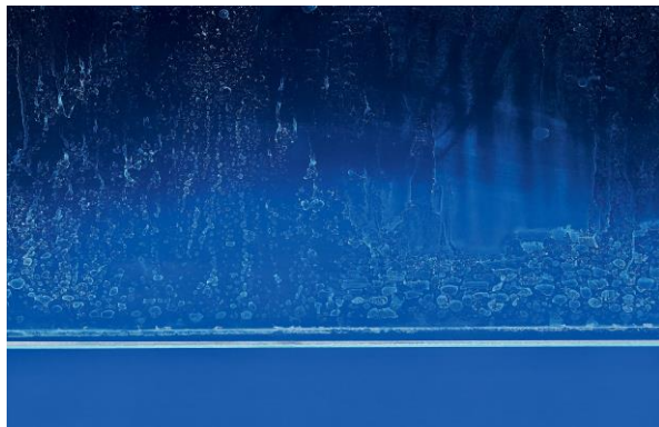
↳ Peu de calcaire