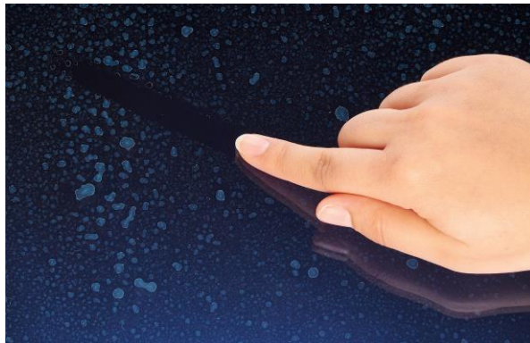
↳ Bonne nettoyabilité