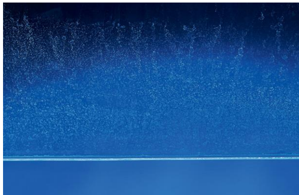
↳ Dépôt de calcaire important