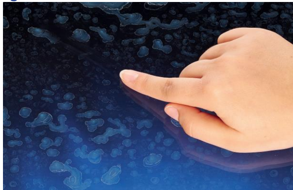
↳ Nettoyabilité moyenne